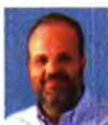
Του Σπύρου Πρωτοψάλτη