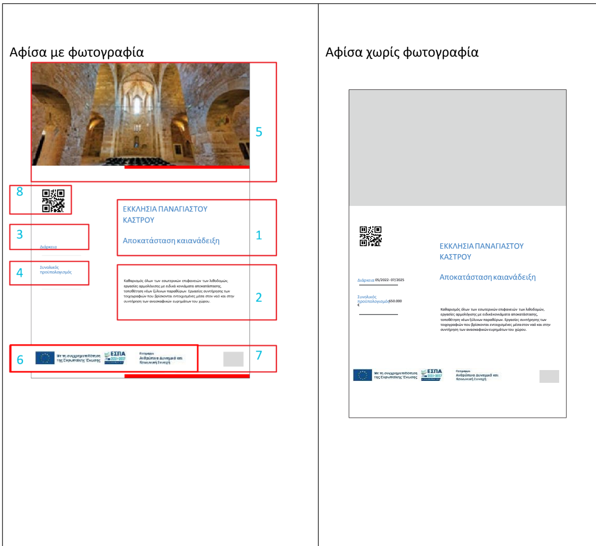
Τα παραδείγματα έχουν παραχθεί μέσω της εφαρμογής on-line generator.

Στις περιπτώσεις που δεν διατίθεται συγκεκριμένη φωτογραφία του έργου δύναται να αξιοποιηθούν τα πρότυπα γραφιστικά της εφαρμογής Generator (βλ. κεφάλαιο 3.6 του παρόντος), ανάλογα με τη θεματική του έργου.