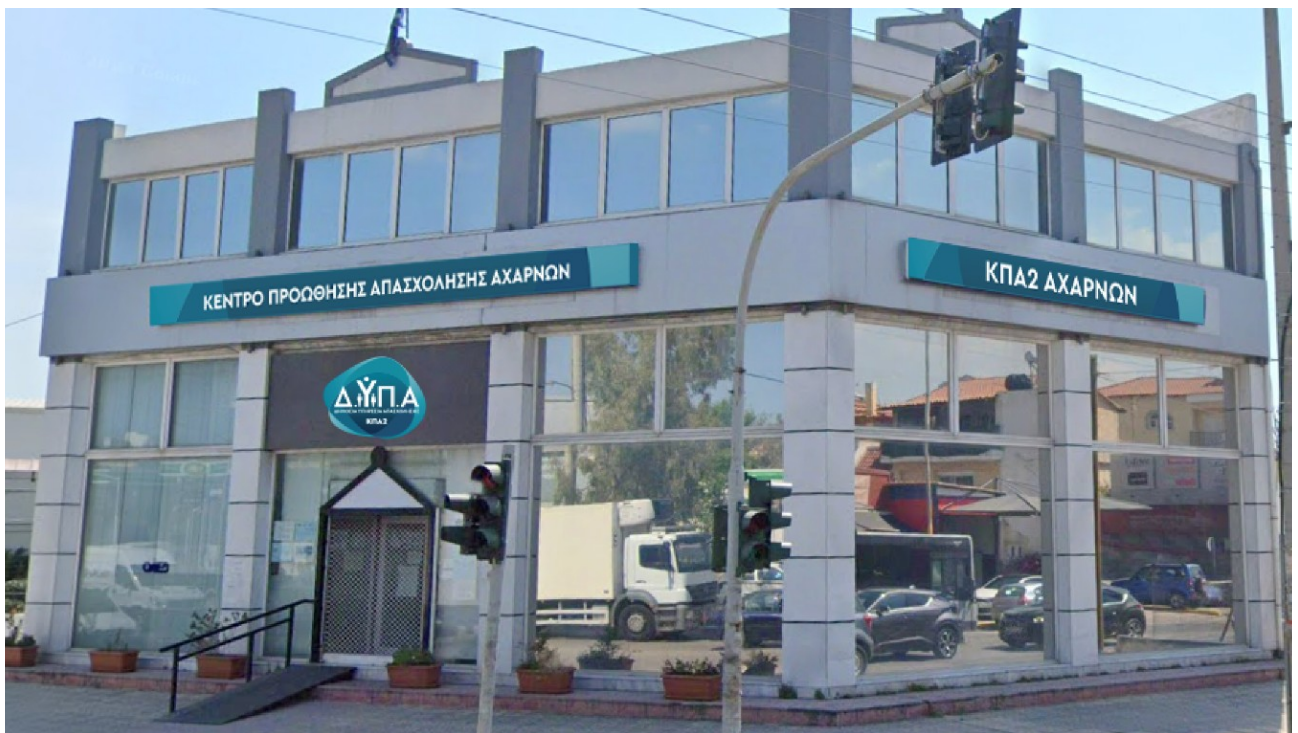
Ενδεικτικές νέες πινακίδες συνδυασμένου τύπου A & B

Συνδυασμός από φωτεινή ή μη πινακίδα τύπου A και τελάρο με βινύλιο τύπου B. Ανάλογα με τη θέση τοποθέτησης, η επιγραφή τύπου A μπορεί να είναι στο κέντρο δύο επιγραφών Τύπου B ή άνωθεν/κάτωθεν μιας επιγραφής Τύπου B.