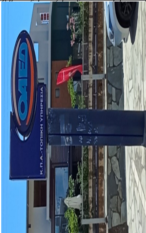
Ενδεικτική πινακίδα τύπου 6

Πινακίδα, οβάλ σχήματος, φωτιζόμενη, επίστυλη η επίτοιχη διπλής όψεως.