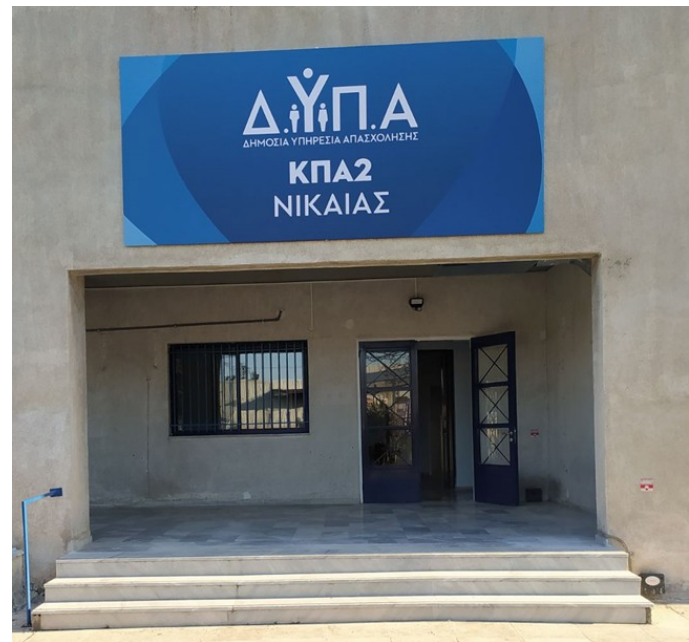
Ενδεικτικές νέες πινακίδες τύπου Β

Η πινακίδα, στο background του λεκτικού, φέρει τμήμα του λογότυπου της ΔΥΠΑ στο χρωματισμό της Υπηρεσίας που αναφέρεται.