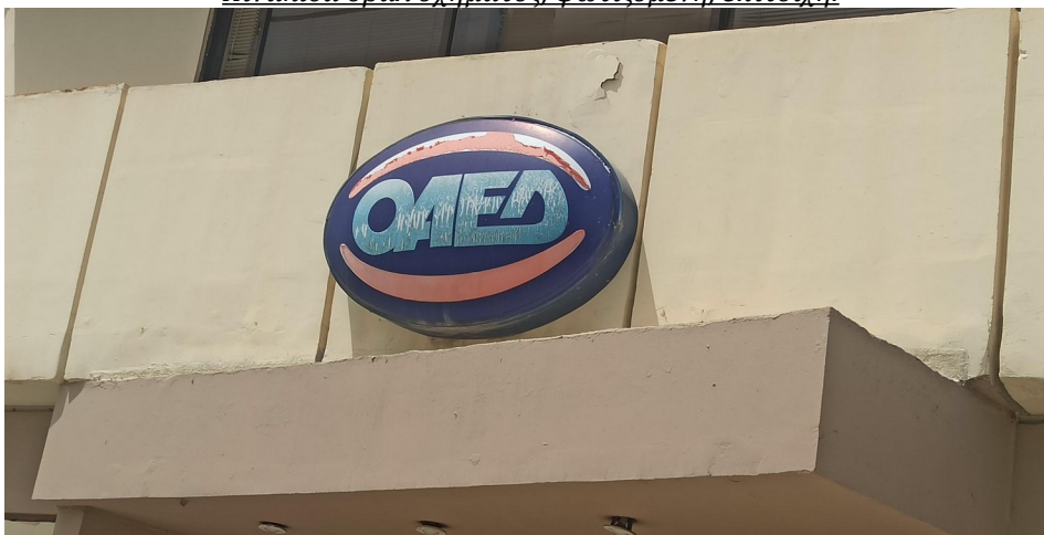
Ενδεικτική εικόνα πινακίδας τύπου 1

Πινακίδα οβάλ σχήματος, φωτιζόμενη, επίτοιχη.