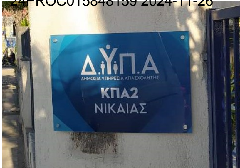
Ενδεικτική νέα πινακίδα συνδυασμένου τύπου Γ

Το μέγεθος της νέας ορθογώνιας επιγραφής είναι τέτοιο που να καλύπτει τα περιθώρια της υφιστάμενης πινακίδας και τις οπές από τους αποστάτες αυτής. Η κατασκευή είναι μη φωτιζόμενη - δεν περιλαμβάνεται φωτισμός στην κατασκευή.