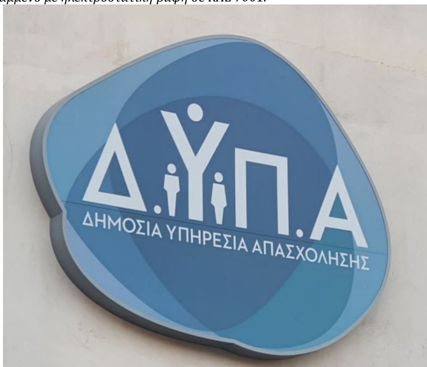
Νέα πινακίδα τύπου Α

Φωτεινή ή μη πινακίδα σε μεταλλικό πλαίσιο πάχους 10 εκ., με plexiglass γαλακτερό πάχους 10mm που φέρει ψηφιακή εκτύπωση σε πολυμερικό αυτοκόλλητο ευρωπαϊκών προδιαγραφών και πλαστικοποίηση ματ. Στην περίπτωση φωτεινής πινακίδας (όπου υπάρχει ήδη παροχή ρεύματος), εντός του μεταλλικού πλαισίου τοποθετείται φωτισμός από συστοιχίες led με τρόπο που η πινακίδα να έχει ενιαίο επίπεδο φωτισμό. Η μεταλλική περίμετρος - σόκορο του πλαισίου, θα έχει μεταλλικό χρώμα ασημί ματ ή βαμμένο με ηλεκτροστατική βαφή σε RAL 7001.