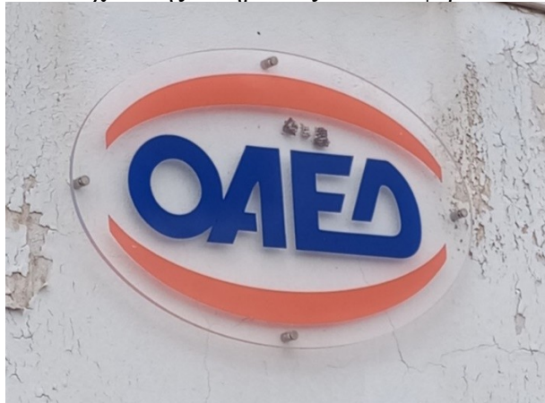
Ενδεικτική εικόνα πινακίδας τύπου 4

Πινακίδα από πλεξιγκλάς, οβάλ σχήματος, με εκτυπωμένο το λογότυπο της υπηρεσίας και με ή χωρίς άλλα στοιχεία της Υπηρεσίας που αναφέρεται.