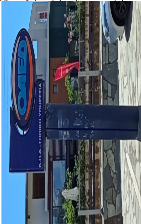
Ενδεικτική πινακίδα τύπου 6

Πινακίδα, οβάλ σχήματος, φωτιζόμενη, επίστευλη η επίτοιχη διπλής όψεως.