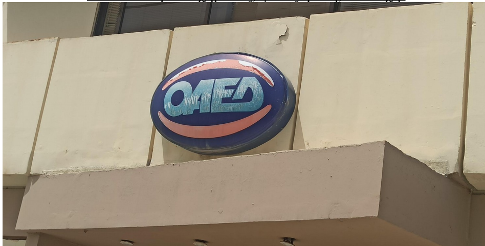
Ενδεικτική εικόνα πινακίδας τύπου 1

Πινακίδα οβάλ σχήματος, φωτιζόμενη, επίτοιχη.