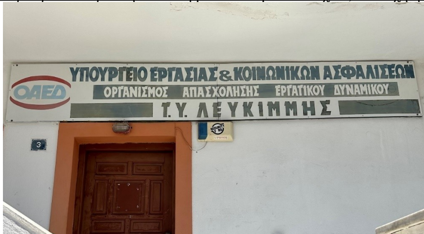
Ενδεικτική εικόνα πινακίδας τύπου 2

Πινακίδα ορθογώνια παραλληλεπίπεδη με εκτυπωμένα στοιχεία, επίτοιχη ή επίστυλη.