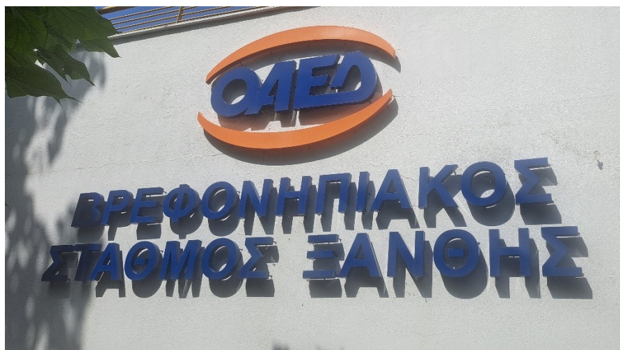
Ενδεικτική εικόνα πινακίδας τύπου 5

Πινακίδα με αποσπώμενα στοιχεία, στερεωμένα το κάθε ένα ξεχωριστά, απευθείας επάνω στην όψη του κτιρίου ή σε ενιαίο φορέα.