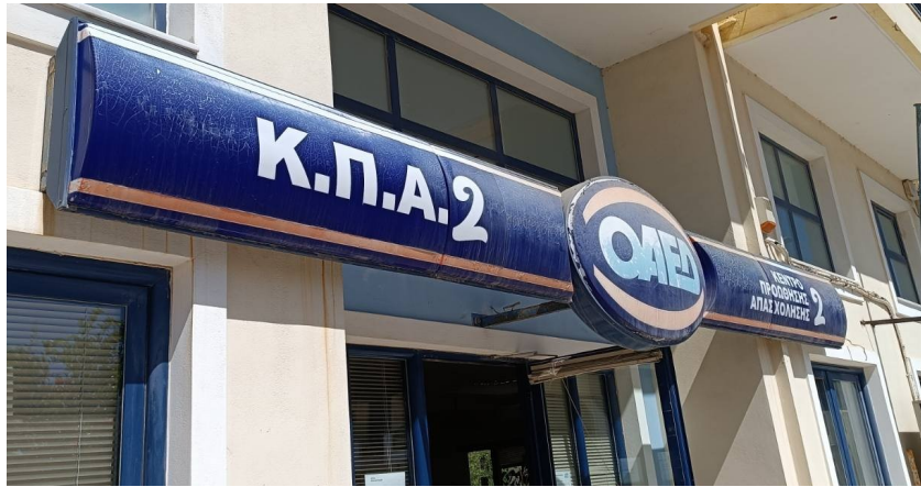
Ενδεικτική εικόνα πινακίδας τύπου 3