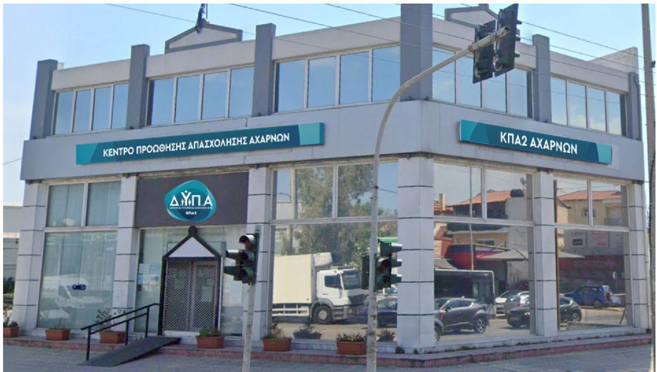
Ενδεικτικές νέες πινακίδες συνδυασμένου τύπου Α & Β

Συνδυασμός από φωτεινή ή μη πινακίδα τύπου Α και τελάρο με βινύλιο τύπου Β. Ανάλογα με τη θέση τοποθέτησης, η επιγραφή τύπου Α μπορεί να είναι στο κέντρο δύο επιγραφών Τύπου Β ή άνωθεν/κάτωθεν μιας επιγραφής Τύπου Β.