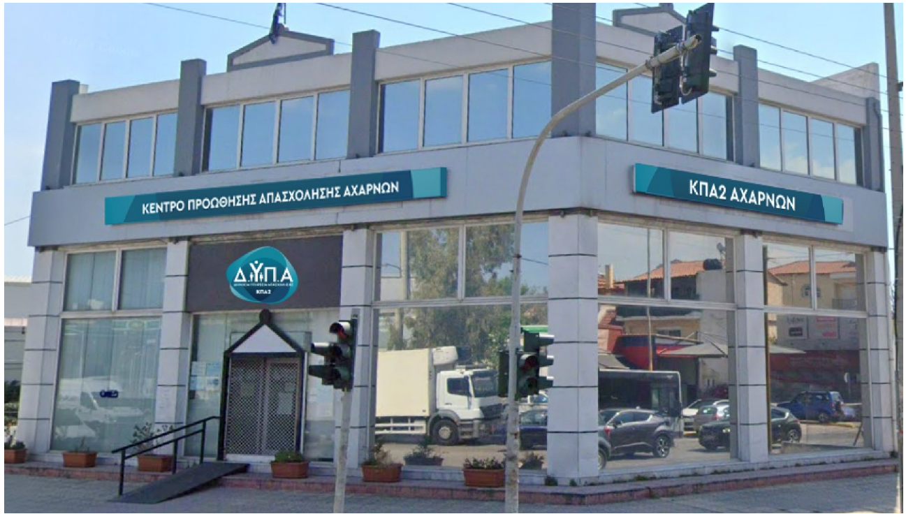
Ενδεικτικές νέες πινακίδες συνδυασμένου τύπου Α & Β