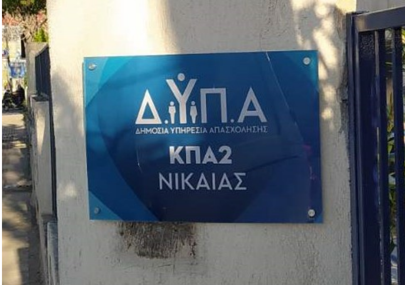
Ενδεικτική νέα πινακίδα συνδυασμένου τύπου Γ

Πινακίδα από πλεξιγκλάς πάχους 8 χιλ. για επιγραφές με διαστάσεις έως 50x70 εκ. / 10 χιλ. για μεγαλύτερες διαστάσεις, ορθογώνιου σχήματος, με εκτυπωμένο το λογότυπο της Δ.ΥΠ.Α και τον τίτλο της Υπηρεσίας όπως το παράδειγμα παρακάτω (στο background φέρει τμήμα του λογότυπου της ΔΥΠΑ στο χρώμα της Υπηρεσίας που αναφέρεται). Τοποθετείται με 4 τουλάχιστον μεταλλικούς ανοξείδωτους αποστάτες (περισσότερους εφόσον το μέγεθος της ορθογώνιας επιγραφής το απαιτεί).