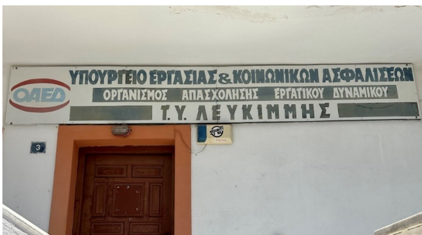
Ενδεικτική εικόνα πινακίδας τύπου 2

Πινακίδα ορθογώνια παραλληλεπίπεδη με εκτυπωμένα στοιχεία, επίτοιχη ή επίστυλη.