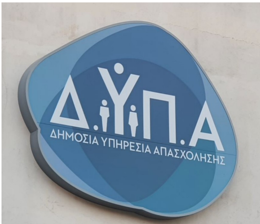
Νέα πινακίδα τύπου Α

Συνδυάζεται συνήθως με τον ΤΥΠΟ Β (βλ. παρακάτω) που θα φέρει τον τίτλο της Υπηρεσίας που σημαίνεται (πχ ΚΠΑ2 Δάφνης).