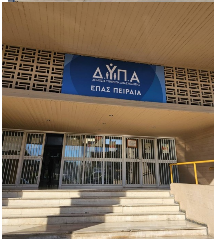
Ενδεικτικές νέες πινακίδες τύπου Β