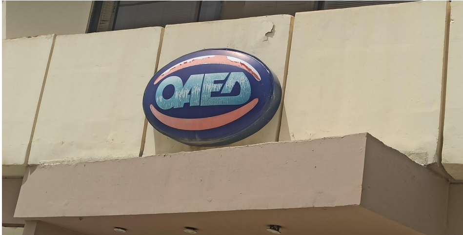
Ενδεικτική εικόνα πινακίδας τύπου 1

Πινακίδα οβάλ σχήματος, φωτιζόμενη, επίτοιχη.