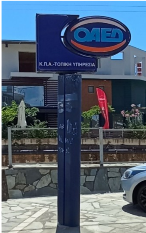
Ενδεικτική πινακίδα τύπου 6

Πινακίδα, οβάλ σχήματος, φωτιζόμενη, επίστευλη η επίτοιχη διπλής όψεως.