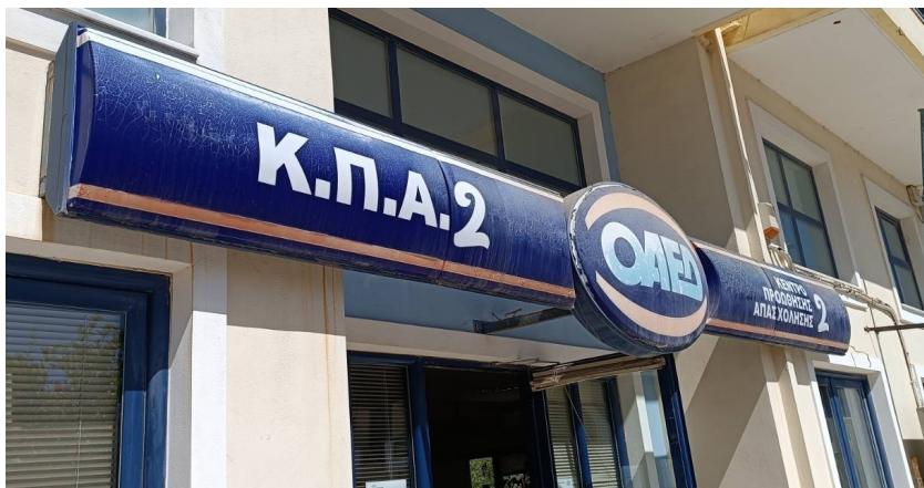
Ενδεικτική εικόνα πινακίδας τύπου 3

Πινακίδα ορθογώνια παραλληλεπίπεδη με τα στοιχεία της δομής και το λογότυπο της υπηρεσίας σε οβάλ σχήμα, φωτιζόμενη, επίτοιχη.