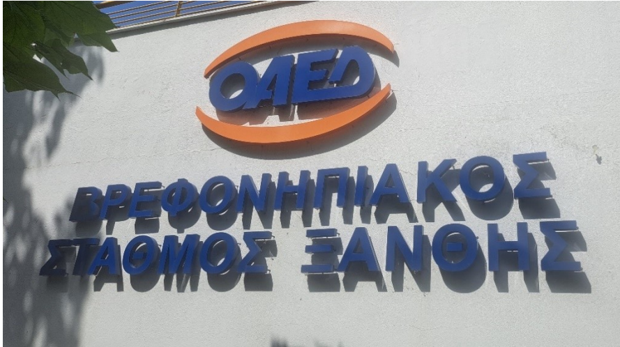
Ενδεικτική εικόνα πινακίδας τύπου 5

Πινακίδα με αποσπώμενα στοιχεία, στερεωμένα το κάθε ένα ξεχωριστά, απευθείας επάνω στην όψη του κτιρίου ή σε ενιαίο φορέα.