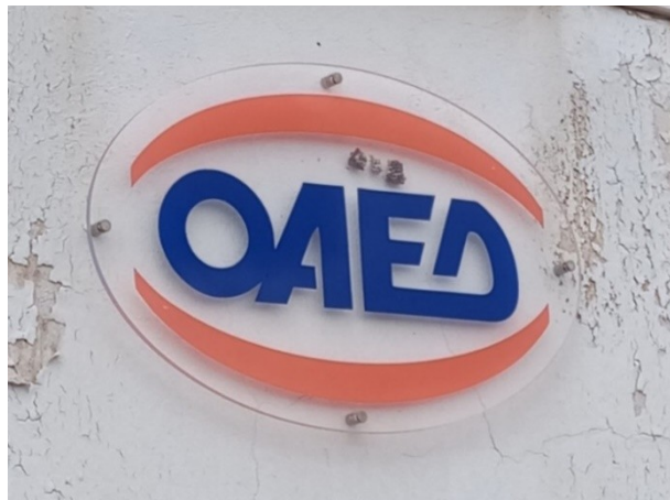
Ενδεικτική εικόνα πινακίδας τύπου 4

Πινακίδα από πλεξιγκλάς, οβάλ σχήματος, με εκτυπωμένο το λογότυπο της υπηρεσίας και με ή χωρίς άλλα στοιχεία της Υπηρεσίας που αναφέρεται.