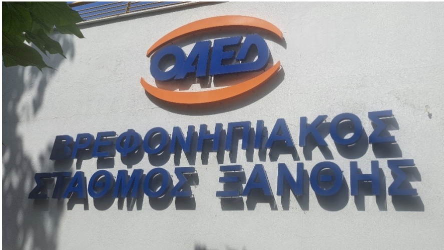
Ενδεικτική εικόνα πινακίδας τύπου 5

Πινακίδα με αποσπώμενα στοιχεία, στερεωμένα το κάθε ένα ξεχωριστά, απευθείας επάνω στην όψη του κτιρίου ή σε ενιαίο φορέα.