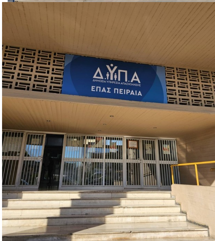
Ενδεικτικές νέες πινακίδες τύπου Β