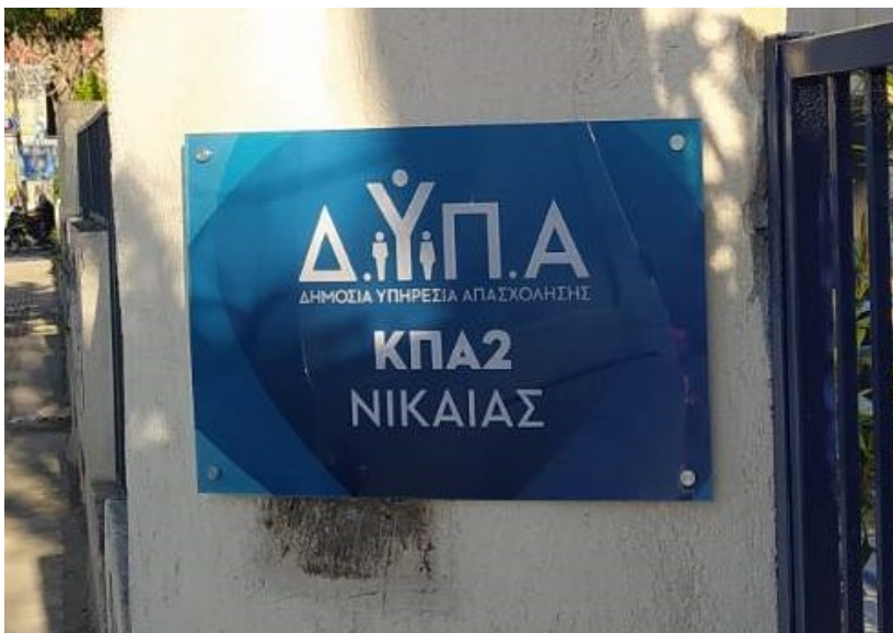
Ενδεικτική νέα πινακίδα συνδυασμένου τύπου Γ

Πινακίδα από πλεξιγκλάς πάχους 8 χιλ. για επιγραφές με διαστάσεις έως 50x70 εκ. / 10 χιλ. για μεγαλύτερες διαστάσεις, ορθογώνιου σχήματος, με εκτυπωμένο το λογότυπο της Δ.ΥΠ.Α και τον τίτλο της Υπηρεσίας όπως το παράδειγμα παρακάτω (στο background φέρει τμήμα του λογότυπου της ΔΥΠΑ στο χρώμα της Υπηρεσίας που αναφέρεται). Τοποθετείται με 4 τουλάχιστον μεταλλικούς ανοξείδωτους αποστάτες (περισσότερους εφόσον το μέγεθος της ορθογώνιας επιγραφής το απαιτεί).