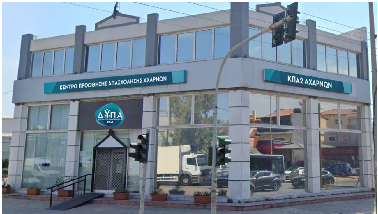
Ενδεικτικές νέες πινακίδες συνδυασμένου τύπου Α & Β