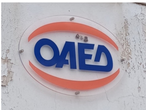
Ενδεικτική εικόνα πινακίδας τύπου 4

Πινακίδα από πλεξιγκλάς, οβάλ σχήματος, με εκτυπωμένο το λογότυπο της υπηρεσίας και με ή χωρίς άλλα στοιχεία της Υπηρεσίας που αναφέρεται.